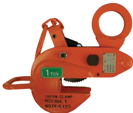
レンフロークランプABA(平吊り)規格寸法