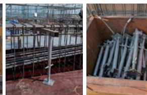
段差違いでの使用